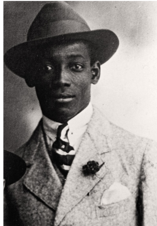
Anton de Kom (1898–1945)

Yad Vashem, 10137927, Righteous Among The Nations