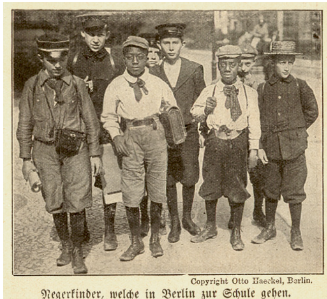
Kwassi Bruce (1893–1964)

Beispiel für quellenbasierten biografischen Zugang zum Vergleich der Handlungsspielräume Schwarzer Männer und Frauen im Nationalsozialismus