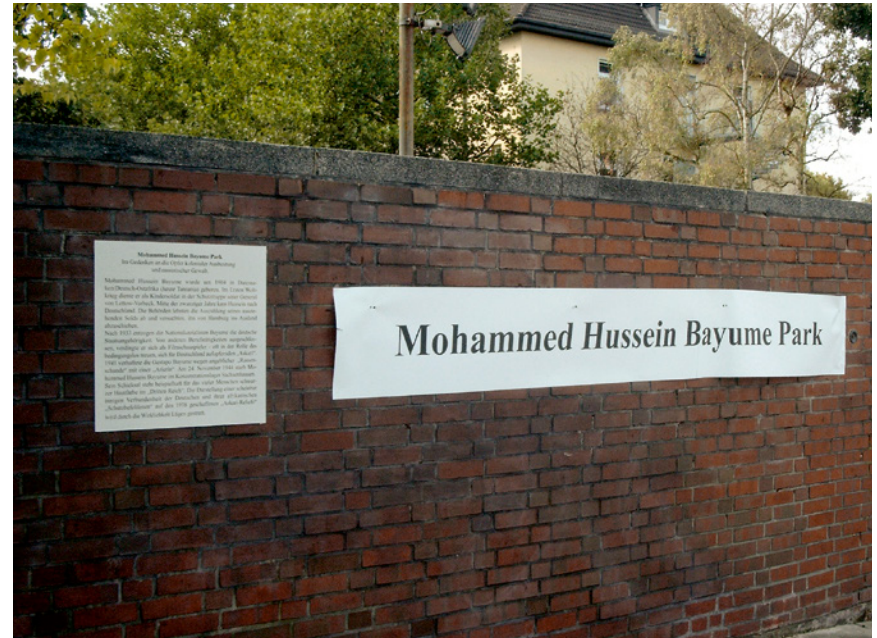
Symbolisch durch Aktivist*innen umbenannte Lettow-Vorbeck-Kaserne, 2003