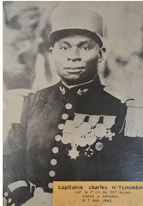
Charles N'Tchoréré (1896–1940)