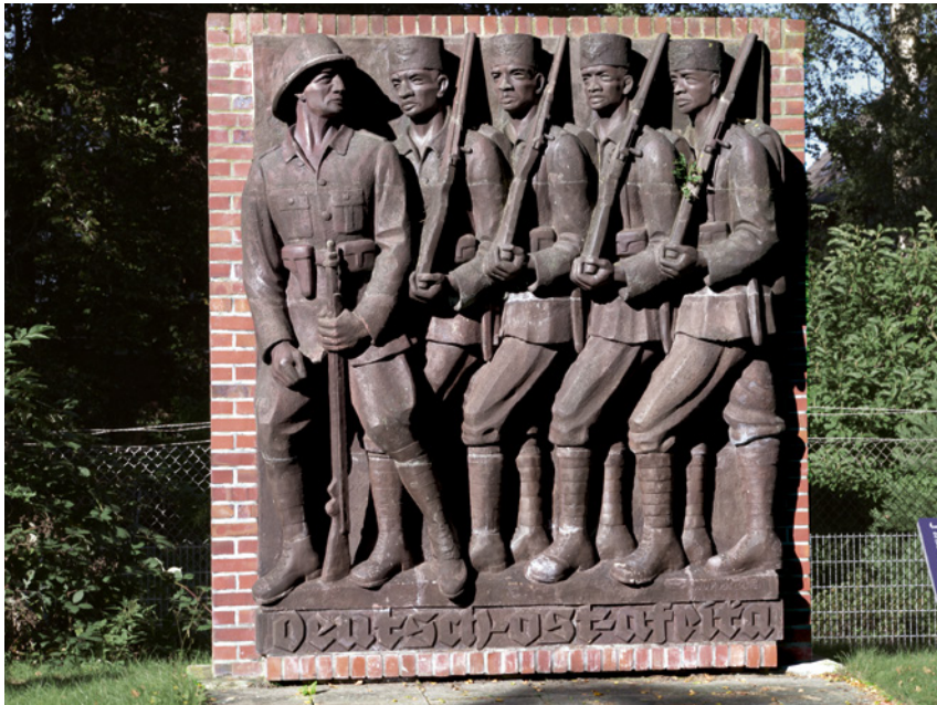
Eines der zwei Teile des 1939 eingeweihten „Schutztruppen-Ehrenmals“ („Askari- Relief“) in der mittlerweile geschlossenen Lettow-Vorbeck-Kaserne, Hamburg